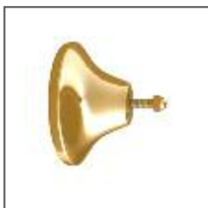
attacco braccio ottonato a spallina