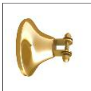
attacco braccio ottonato frontale