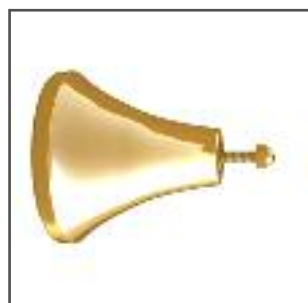
attacco braccio ottonato a spallina lato arganello