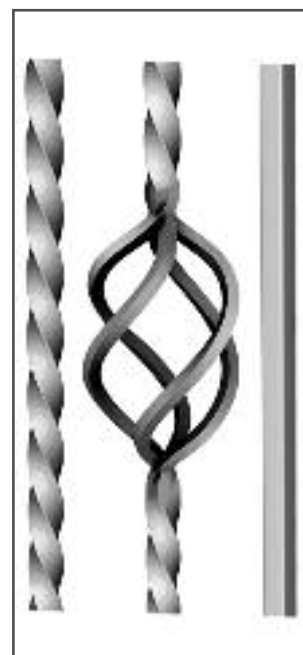
PARTICOLARI DI LAVORAZIONE