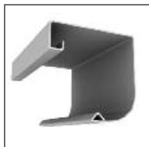
cassonetto in ferro